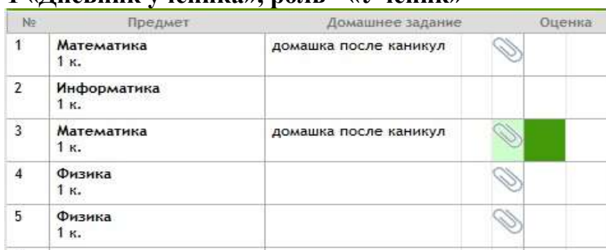
Рисунок 1 «Дневник ученика», роль - «Ученик»

- выполненную учебную работу ученик прикрепляет в разделе «домашнее задание» в тот день, когда была прикреплена карта урока. Чтобы прикрепить свою работу необходимо нажать на «Скрепку». Появится окно «Добавление домашнего задания». Необходимо нажать на кнопку «Выберите файл» и прикрепить фото/документ с выполненной учебной работой и нажать на кнопку «Заккрыть».